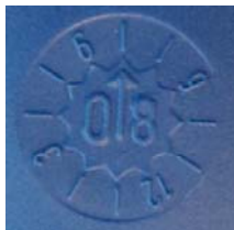
Eksempel på emballage der er produceret i syvende måned 2008